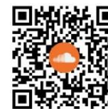
申請安心畢業方案